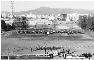
市役所西側催事広場